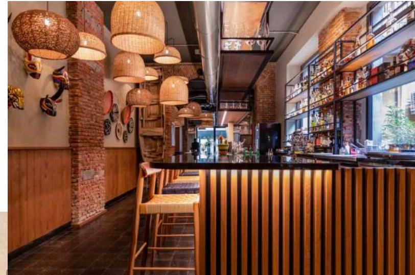
Vista dell'ingresso dall'interno del locale