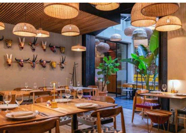
Interno con vista giardino

Il locale commerciale si sviluppa su 274 mq al piano terra e altri 77 mq al piano S1 . Si viene accolti in una zona ingresso per poi proseguire nella sala principale dove è presente un'affascinante patio giardino .