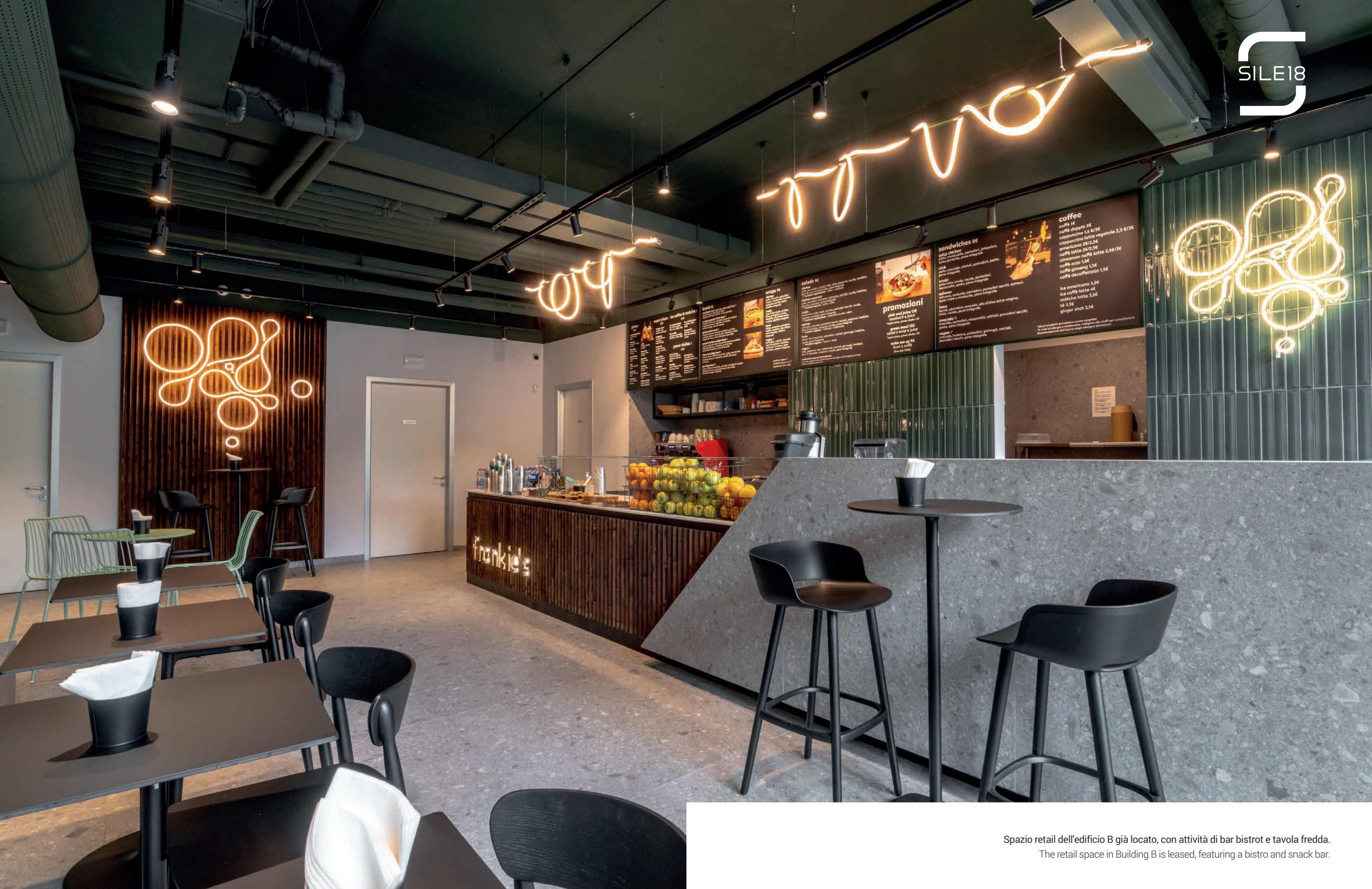
Spazio retail dell'edificio B già locato, con attività di bar bistrot e tavola fredda. The retail space in Building B is leased, featuring a bistro and snack bar.